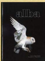
Alba : Baudvin & Perrot