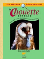
La Chouette effraie, Jean-Louis Vallée, Delachaux et Niestlé