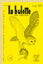
La hulotte n°12 : grande enquête sur l'effraie (mai 1973)