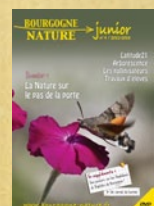
La Nature sur le pas de la porte Bourgogne-Nature Junior n°4. Bourgogne-Nature

Cette fiche technique est mise en page par :